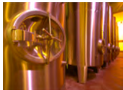
ステンレスタンク

シュタイニンガー氏がスパークリングワインを造りはじめるきっかけは、シャンパーニュ地方への訪問だったそうです。高級シャンパーニュの品質を狙い、シャンパーニュ(瓶内二次発酵)方式でスパークリングワインを造っています。高級ゼクトの基は高級ワインです。畑での仕事を大切に健康な環境を保つ事が条件の一つです。自然とのバランスを崩さないように、人工肥料を使っていません。そしてヘクタール当たりの収穫生産量も制限しています。全てのゼクトは最低18ヶ月間瓶内醗酵を行います。彼のこだわりでもある単一品種での醸造により品種それぞれの特徴を存分に活かした、クリーンで飲み応えのあるワインを造り出しています。