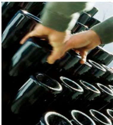
ル・ルミュアージュ(動瓶)